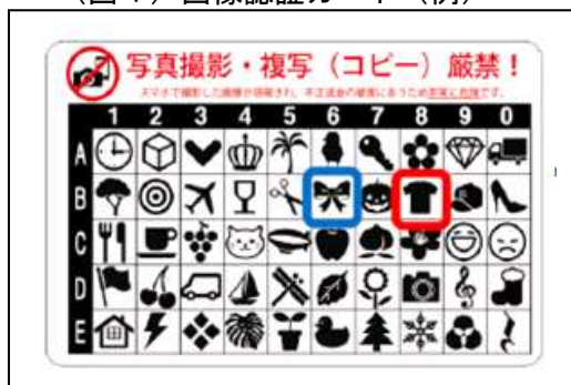
（図1）画像認証カード（例）