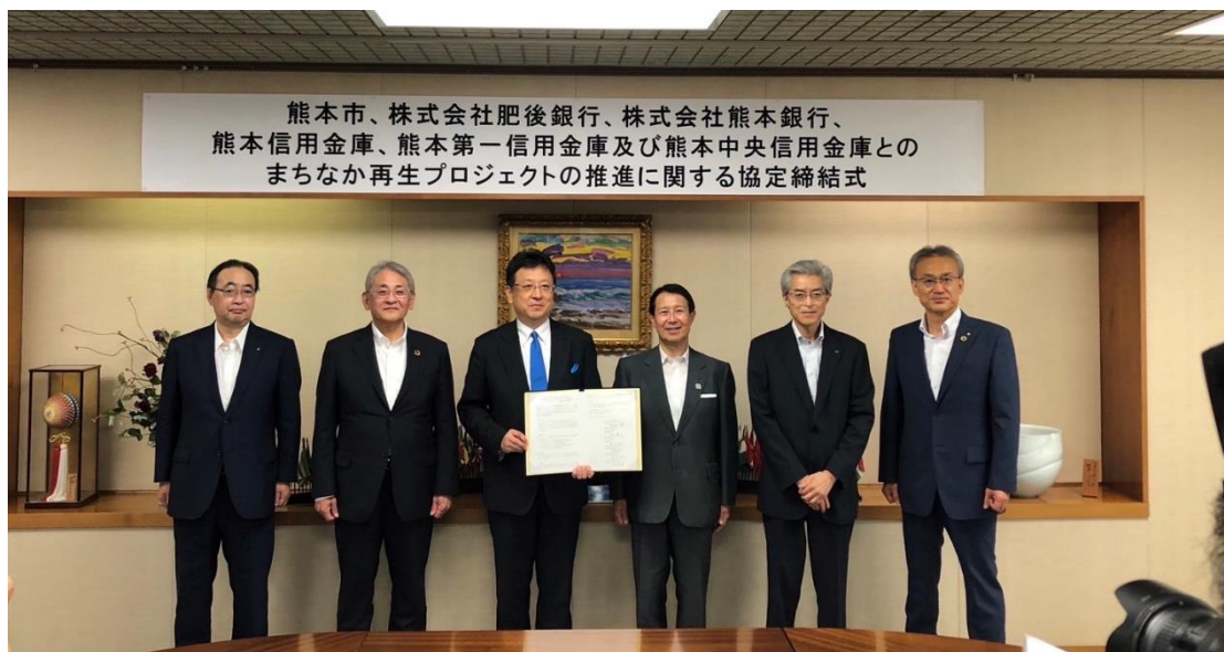
9月5日（火）まちなか再生プロジェクトの推進に関する協定締結式

◇お申込に際しては所定の審査を行い、審査結果によってはご希望に添えない場合がございます。